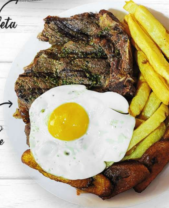
Churrasco a lo pobre