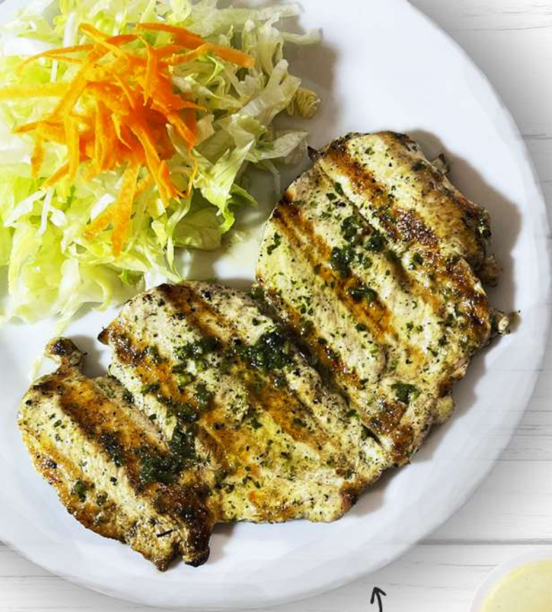
Filete de peito