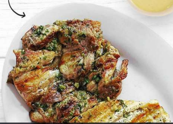
Deshuesado de Pierna