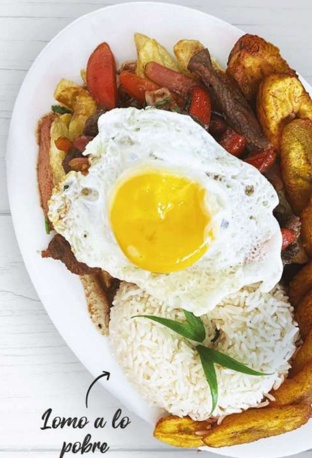
Lomo a lo pobre